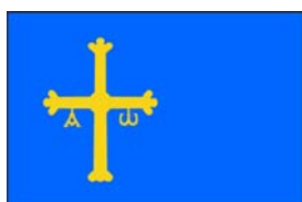
PRINCIPADO DE ASTURIAS