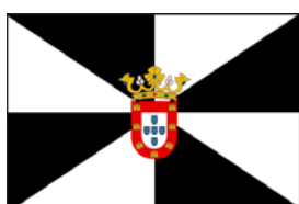
CIUDAD AUTÓNOMA DE CEUTA