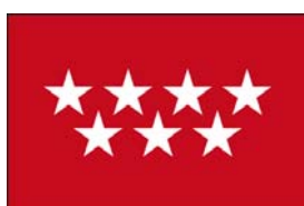
COMUNIDAD DE MADRID