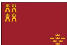
REGIÓN DE MURCIA