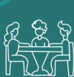
Seminarios de contacto