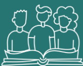
Visitas de estudio