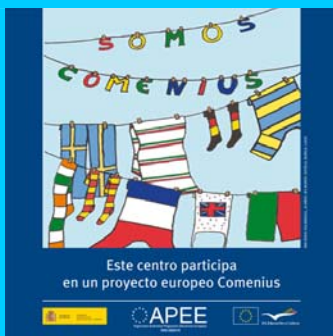
PLACA SOMOS COMENIUS

Se centra en los diversos países que forman parte de la Unión Europea. La idea se basa en la representación de las banderas de algunos de los países en cuestión, como si fueran