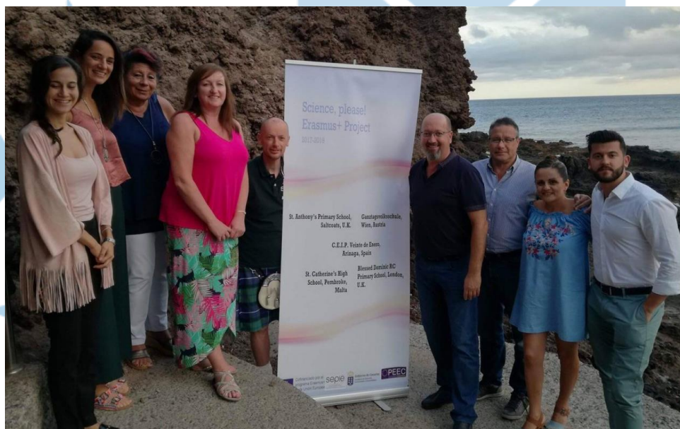
Autoridades y socios durante la Semana Erasmus+ C.E.I.P. Veinte de Enero

R: Además de dotar de un carácter internacional a nuestro centro educativo y abrirnos la puerta a nuevas culturas, las actividades realizadas en el proyecto “3R’s: Read, Reuse, Recycle! ” permitieron hacer sostenibles los aprendizajes conseguidos a través del propio proyecto. Se trata de un proyecto que no solo ha permitido alcanzar los objetivos de lectura y aprendizaje de la competencia en lenguas extranjeras, sino que ha sido clave para fomentar un uso innovador de las Tecnologías de la Información y la Comunicación más allá de las presentaciones.