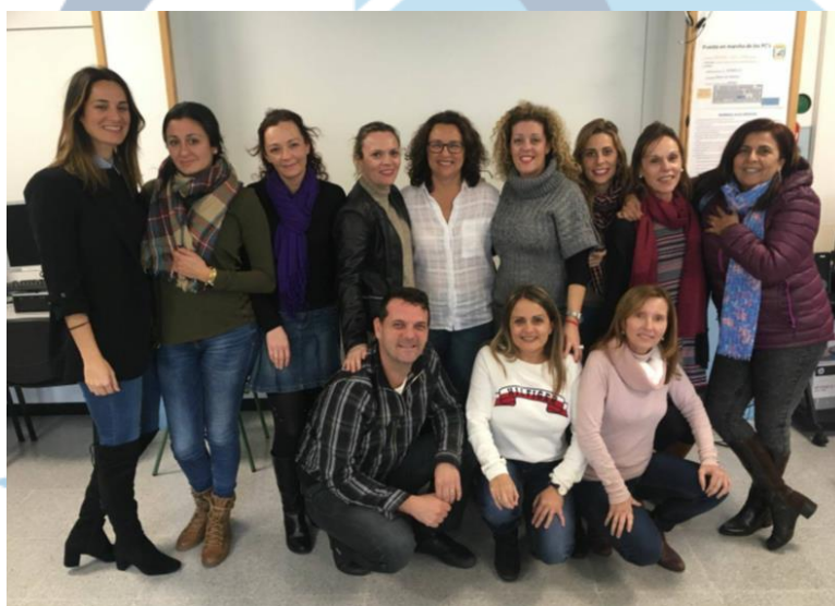
Equipo Erasmus+ C.E.I.P. Veinte de Enero