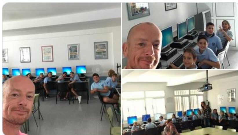
Los socios de Escocia visitan las aulas del C.E.I.P. Veinte de Enero