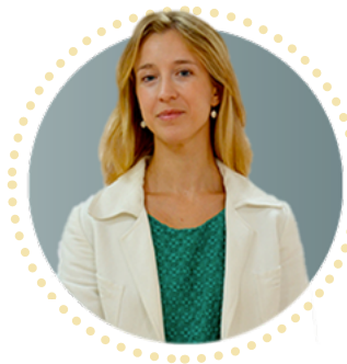
CORAL MARTÍNEZ ÍSCAR DIRECTORA DE SEPIE

Aquí os presentamos a todos ellos, que son ejemplos de verdaderos “Embajadores del cambio” . Haz clic en su fotografía para conocer su testimonio.