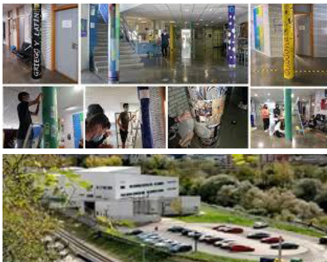
Visita al IES Valle de Aller, Moreda, Principado de Asturias