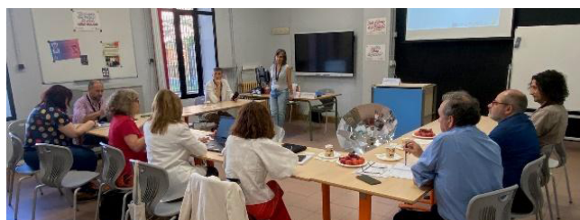
Visita al IES La Merced, Valladolid, Castilla y León